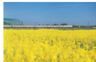
大宮公園～大和田間