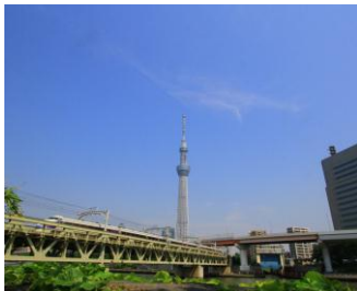
浅草～とうきょうスカイツリー間